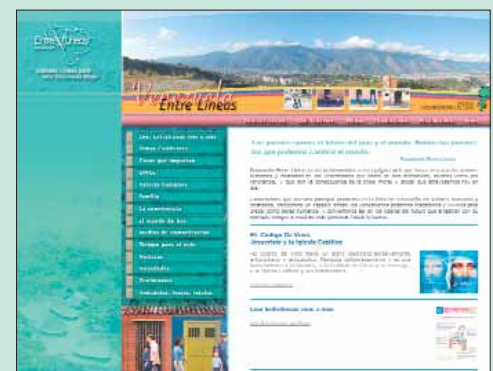
Vista de nuestra nueva página web

Te invitamos a visitarla y recuerda que estamos trabajando día a día para ti, por eso haznos saber tu opinión por medio de entrelines@venezuelaentrelines.com .